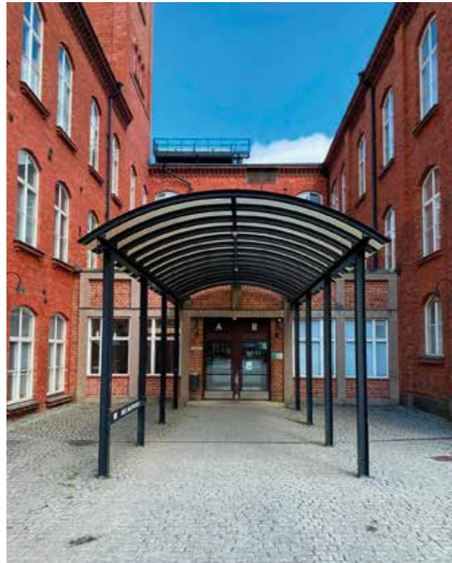
Suurin osa Wahren-opiston tiloista sijaitsee Kehräämön alueella, mutta opetusta annetaan muuallakin Forssan ja Tammelan seudulla.